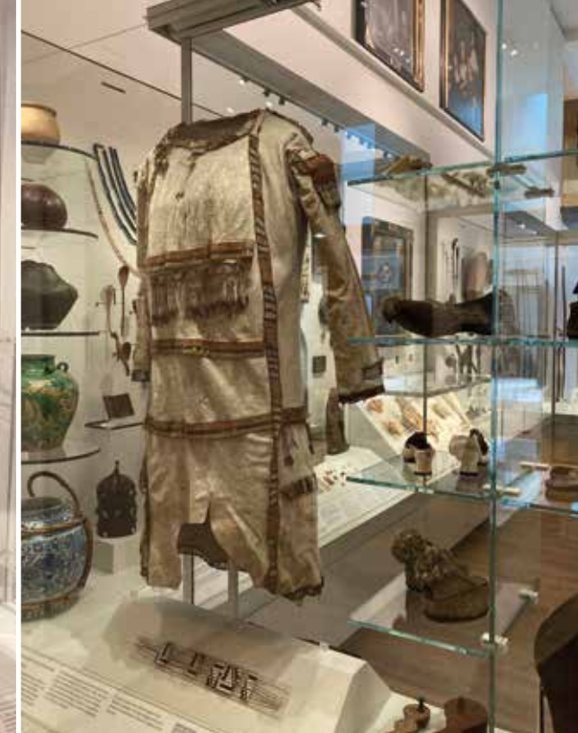
Ginny-tromme fra 1656 fra Vestafrika fremstillet af elefanthud og træ, naturhistoriske genstande og en Match-coat tunika fra Canada fremstillet i første halvdel af det syttende århundrede. Genstandene er udstillet på the Ashmolean Museum i Oxford i udstillingen The Ashmolean Story .

I bogen Knowing Things: Exploring the Collections at the Pitt Rivers Museum 1884-1945 fra 2007 beskriver Chris Gosden og Frances Larson, hvordan de besøgendes opfattelse af museet, som et uforanderligt og tidløst sted, hænger sammen med de gamle, håndskrevne etiketter, der stadig ses udstillet sammen med museets genstande. I kombination med den overvældende samling af montere, skabe og skuffer fyldt med genstande fra hele verden, er etiketterne med til at skabe et indtryk af et victoriansk museum, der på sælsom vis har overlevet det tyvende århundredes dekoloniale bevægelser og er forblevet intakt og uforstyrret frem til i dag. I virkeligheden er ingen af museets originale udstillingsdele bevaret. Gennem årene har Pitt Rivers