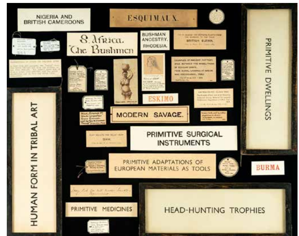
Eksempler på udstillingstekster på Pitt Rivers Museum med koloniale stednavne og betegnelser af nedsættende karakter.

Rivers hviler på. Foruden Labelling Matters kan nævnes det nu afsluttede The Relational Museum -projekt og det EU-støttede Taking Care -initiativ. Begge projekter har fokuseret på at inddrage repræsentanter fra de befolkningsgrupper, som samlingerne stammer fra. Ved at etablere samarbejder med folk, hvis forfædres genstande befinder sig på museet, ønsker Pitt Rivers kuratorer at skabe et inkluderende rum, hvor der er plads til en mangfoldighed af fortællinger, og hvor alle befolkningsgrupper betragtes som ligeværdige bidragydere til produktion af viden. Under Pitt Rivers nedlukning i forbindelse med Covid19-pandemien i 2020, gik museets kuratorer nye veje for at gentænke formidlingen af deres sam-