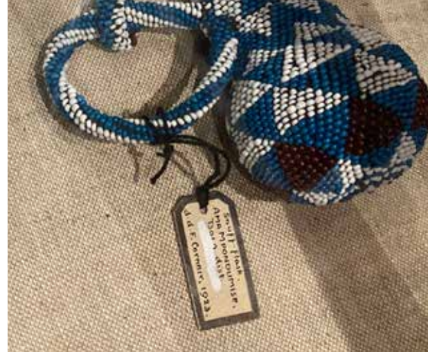
Genstandstekst udstillet på Pitt Rivers Museum. Dele af den oprindelige tekst blev i 1980'erne overmalet med rettelak.

Historisk set er det ikke et nyt fænomen, at museer forsøger at engagere deres besøgende og udfordre deres synspunkter. Som Eilean Hooper-Greenhill allerede påpegede i 2006 i kapitlet Changing Values in the Art Museum: Rethinking Communication and Learning , er ideen om, at museer kan udvikle sig og fungere isoleret fra andre sociale og kulturelle institutioner i samfundet ikke længere gældende. Siden 1980'erne har såvel postmodernismen som postkolonialismen gjort betydningsfulde opgør mod gældende samfundsstrukturer, forhold og værdier – opgør, der med bevægelser som Black Lives Matter og Rhodes Must Fall i de seneste år kun har fået endnu mere vind i sejlene. Pitt Rivers' tilføjelser til den permanente udstilling kan ses som en del af denne udvikling. Thompson-Odlum betragter imidlertid ikke meta-teksterne som decideret dekoloniale, men som en måde, hvorpå museet kan medvirke til at afmystificere og udfordre kolonialistiske tankemønstre.