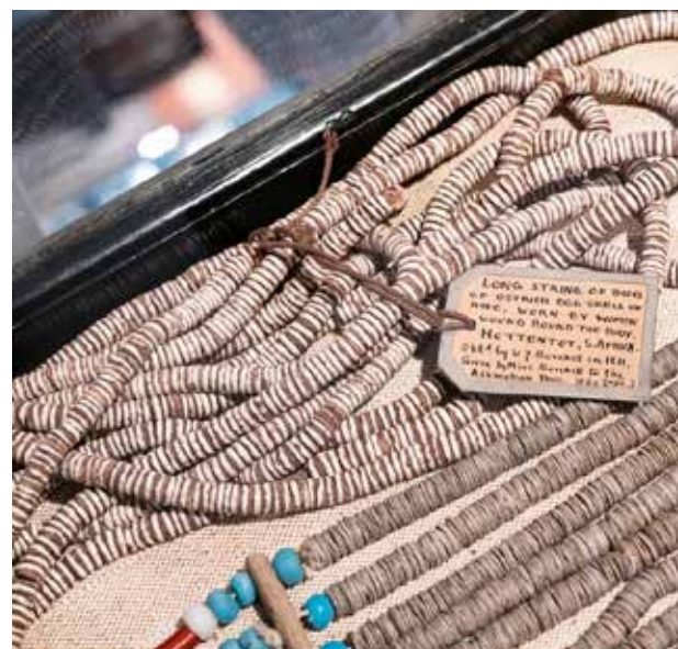
Genstandstekst fra en af Pitt Rivers Museums udstillingsmontre, der viser genstande fra Sydafrikas oprindelige Khoekhoen-befolkning.

Hun finder denne kritiske stillingtagen til fortidens klassificerings- og formidlingspraksisser "vigtig for alle museer, men i særdeleshed for et museum som Pitt Rivers, hvis højest problematiske genstandstekster på forskellig vis er med til at opretholde kolonialismen". For Thompson-Odlum er det væsentligt at tænke over, hvilke former for viden, der videreføres fra én generation til den næste og at gentænke, hvilket sprog, der anvendes. Men hvordan føres denne gentænkning mere konkret ud i livet?