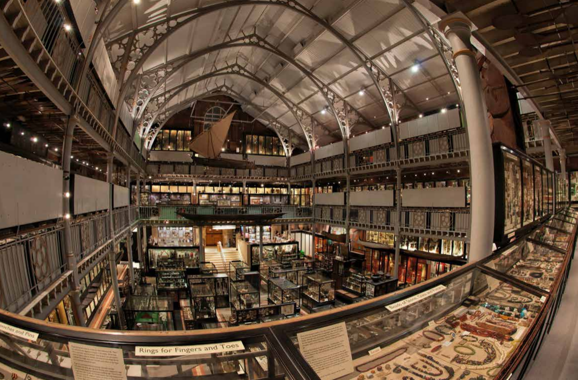
Pitt Rivers Museum, der huser mere end 500.000 genstande, fotografier og manuskripter fra hele verden.

af den evolutionistiske tænker og teoretiker Herbert Spencer (1820-1903), mente Pitt-Rivers, at menneskets udvikling kunne vises igennem genstandes udvikling i form og funktion. Genstande med samme funktion blev følgelig grupperet og udstillet i serier, der startede med simpelt udformede genstande og afsluttedes med mere komplekst udformede genstande.