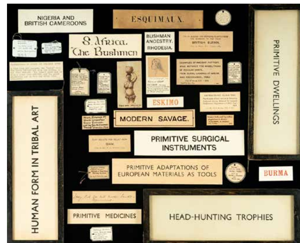
Eksempler på udstillingstekster på Pitt Rivers Museum med koloniale stednavne og betegnelser af nedsættende karakter.

Rivers hviler på. Foruden Labelling Matters kan nævnes det nu afsluttede The Relational Museum -projekt og det EU-støttede Taking Care -initiativ. Begge projekter har fokuseret på at inddrage repræsentanter fra de befolkningsgrupper, som samlingerne stammer fra. Ved at etablere samarbejder med folk, hvis forfædres genstande befinder sig på museet, ønsker Pitt Rivers kuratorer at skabe et inkluderende rum, hvor der er plads til en mangfoldighed af fortællinger, og hvor alle befolkningsgrupper betragtes som ligeværdige bidragydere til produktion af viden. Under Pitt Rivers nedlukning i forbindelse med Covid19-pandemien i 2020, gik museets kuratorer nye veje for at gentænke formidlingen af deres sam-